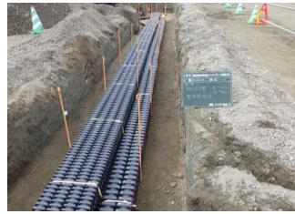
電気管路敷設完了