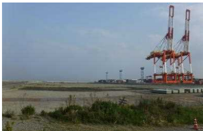
路床盛土 作業開始前 令和元年5月上旬