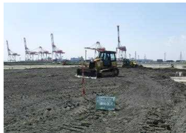
路床盛土工事 令和元年5月下旬