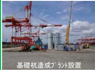
基礎杭造成プラント設置

5月は、入出場管理ゲートと道路部に土を運んで土地造成を行いました。 6月中旬より、入出場管理ゲートの基礎杭の施工を行います。