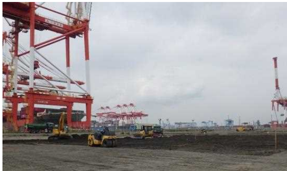
路床盛土 令和元年6月