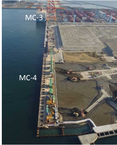
平成31年 1月 月上旬