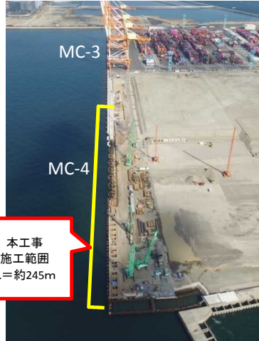
平成31年 2月 下旬