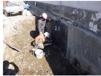
裏込工 防砂目地板補修 平成31年3月