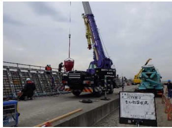
上部工 コンクリート打設 平成30年12月