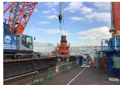
先行削孔・置換状況 令和 3年 1月