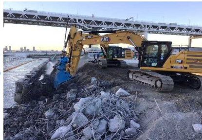
撤去工（栈橋式上部工撤去） 令和 2年12月