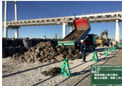
裏込石撤去運搬 令和 2年12月～令和 3年 1月