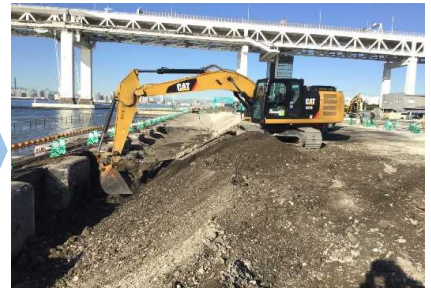
撤去工（裏込石撤去） 令和 3年 1月