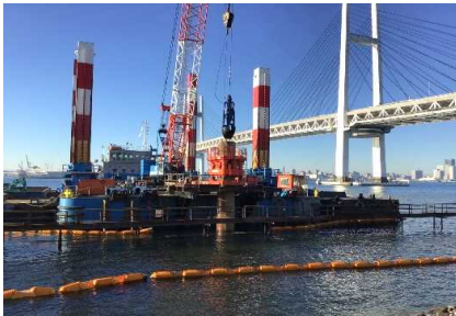
本体工（先行削孔・置換） 令和 2年12月