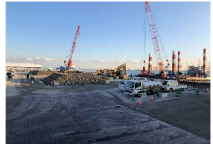
裏込石撤去場内仮置状況 令和 3年 1月