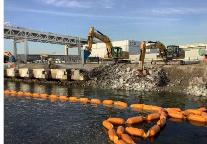
栈橋式上部工撤去状況 令和 2年12月～令和 3年 1月