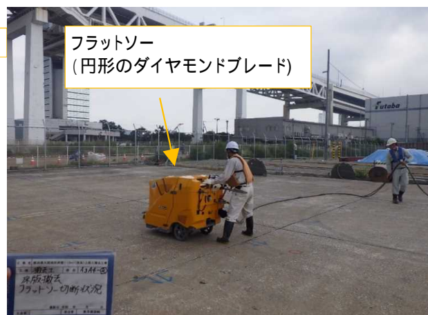
上部工コンクリート切断 令和元年8月