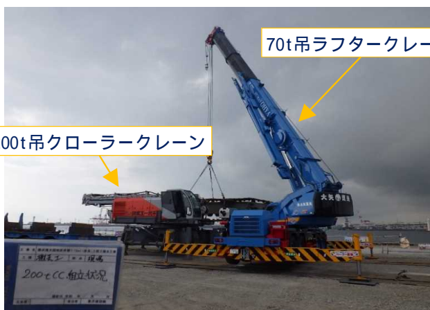
200tクレーン組立 令和元年8月