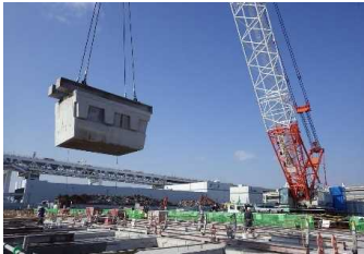
既設棧橋 撤去 平成30年 2月