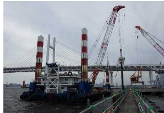
鋼管矢板打設 平成30年 4月