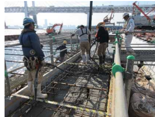
頂部コンクリート打設 平成30年 8月