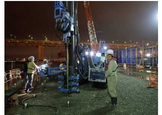
地盤改良工 削孔 平成30年11月