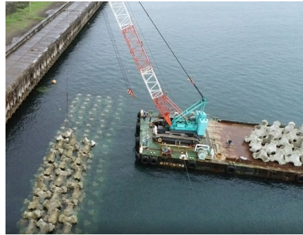
消波ブロック据付状況