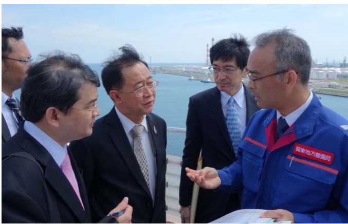
展望台での鹿島港概要説明の様子②