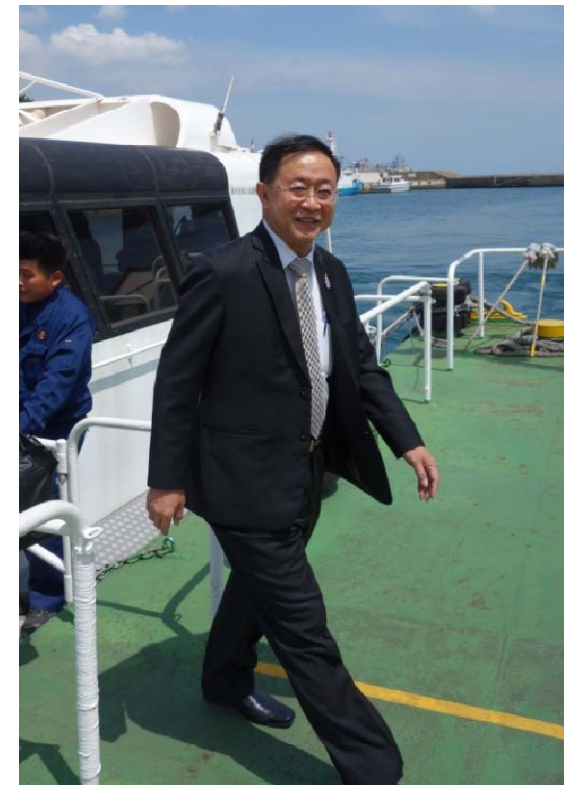
視察船から下船されるアーコム長官