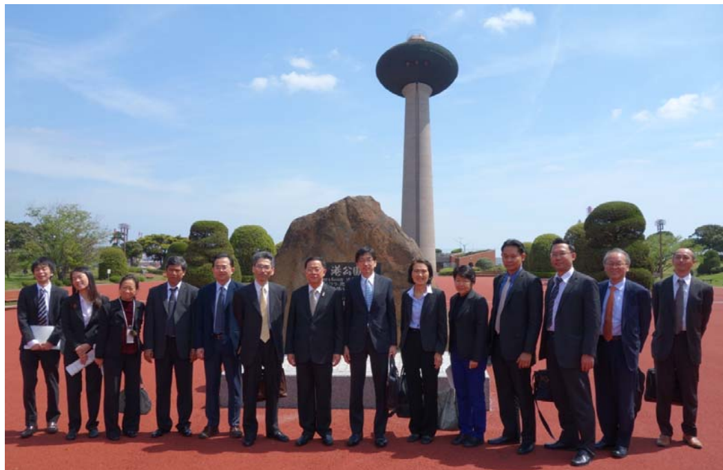
港公園展望台前での集合写真

掘込港湾である鹿島港を一望できる「港公園展望台」にて港の概要、及び開発経緯を当所所長から説明を受けられた後、実際に船で港内を航行していたき、立地企業による荷役の様子を間近でご覧いただくことで、同港への理解を深めていただきました。