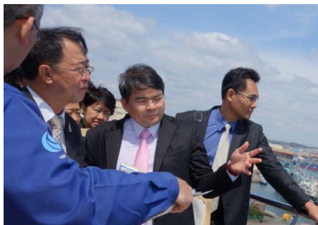
展望台での鹿島港概要説明の様子③