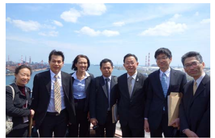
展望台での集合写真