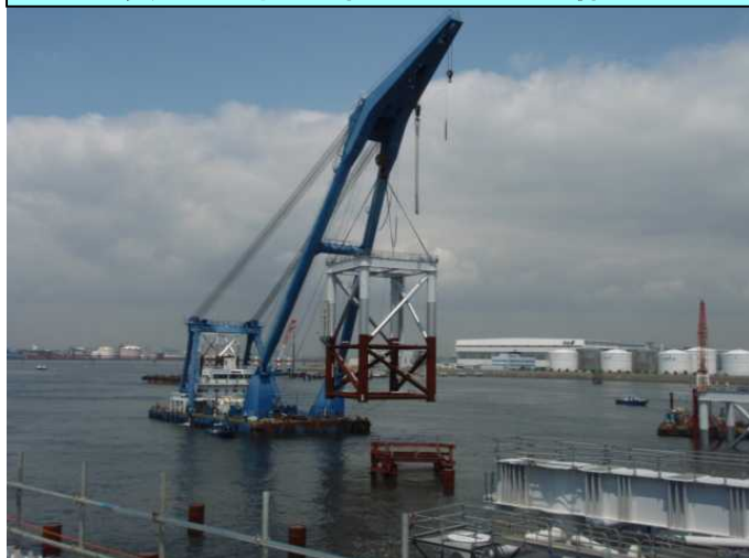
場周道路橋梁部のジャケット据付