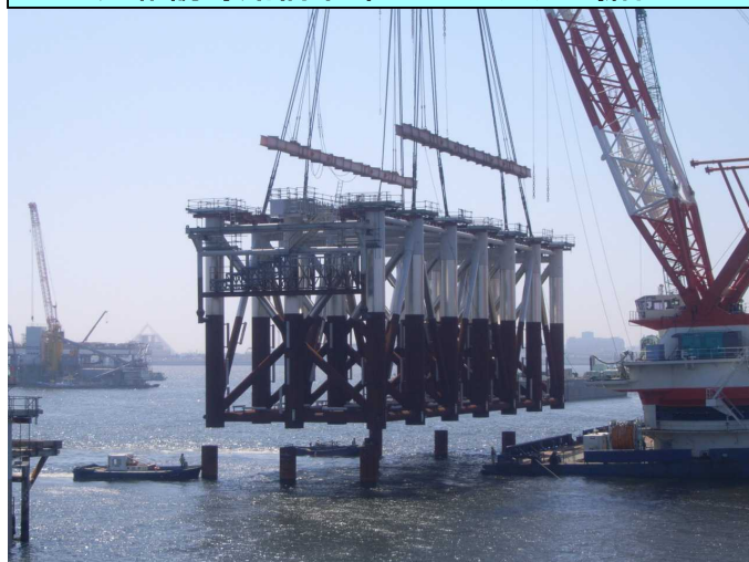
連絡誘導路橋梁部のジャケット据付