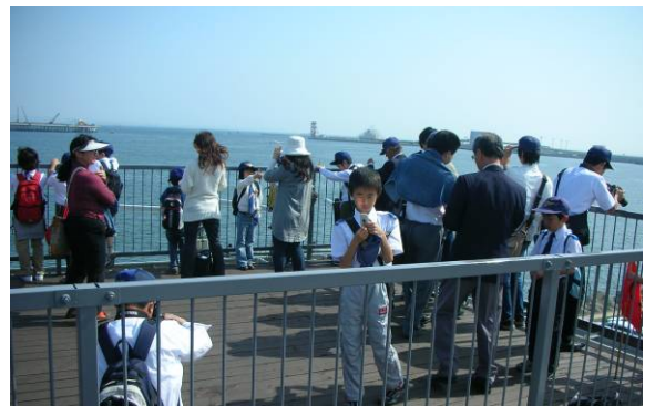
東京湾とD滑走路を一望できる展望台の屋上