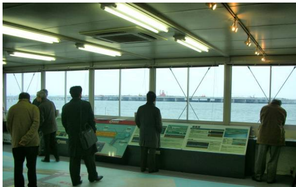
展示パネルを用いたD滑走路の説明