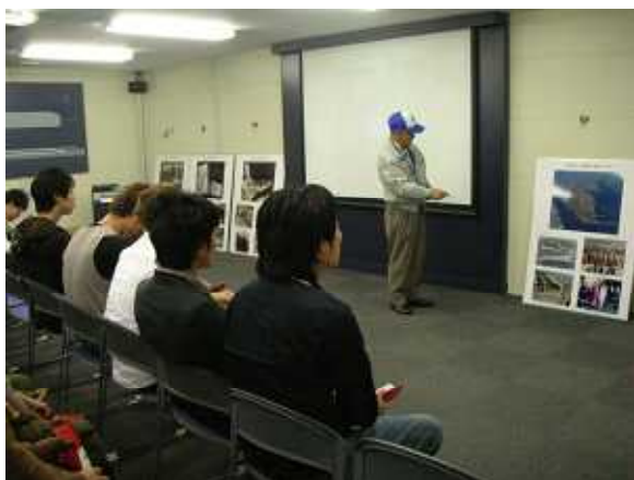
映像や展示パネルを用いたD滑走路の説明