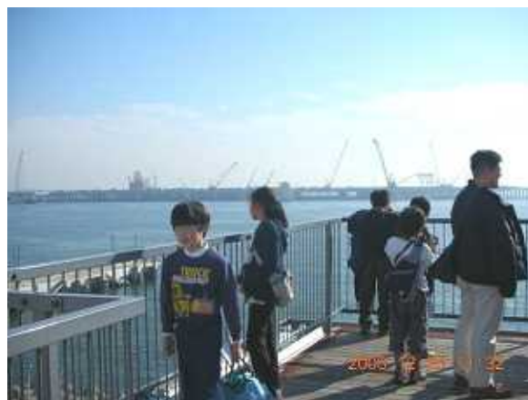
東京湾とD滑走路を一望できる屋上展望台