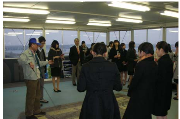
展示パネルを用いたD滑走路の説明