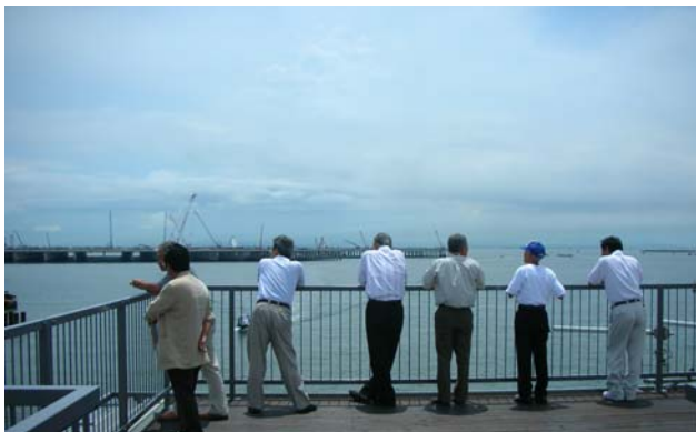
東京湾とD滑走路を一望できる展望台の屋上