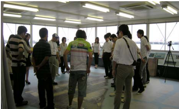
展示パネルを用いたD滑走路の説明