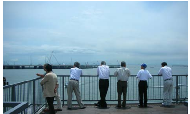
東京湾とD滑走路を一望できる展望台の屋上