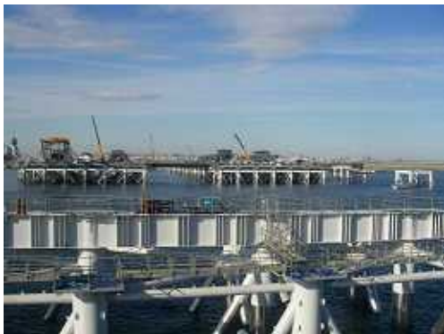
写真；連絡誘導路部の工事状況 (H21. 1. 6 撮影)