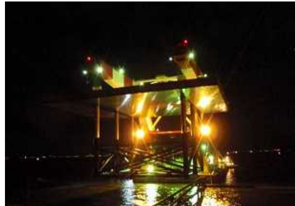
写真；栈橋部ジャケット 100 基目据付状況(H21. 1.11 撮影)