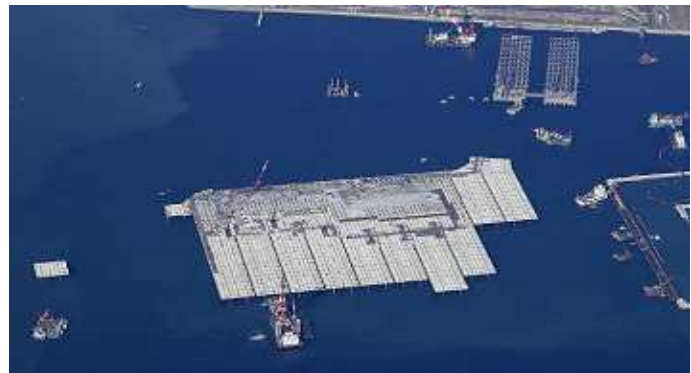
写真；栈橋部・連絡誘導路部の状況 (H20.11.30 撮影)