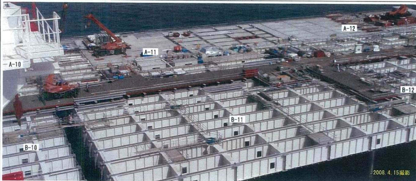
ジャケット間結合工