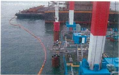
ジャケット掘付工