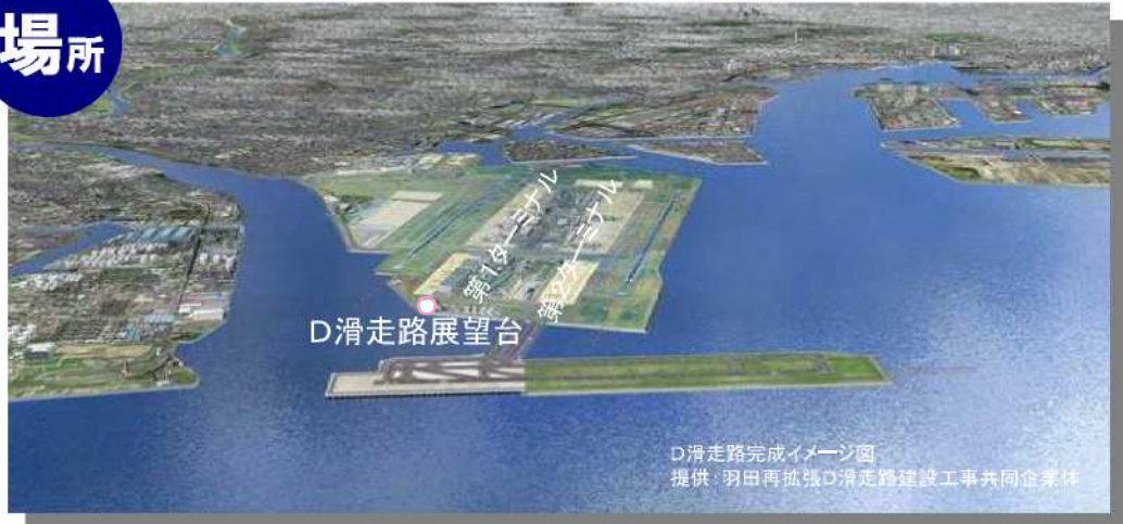
D滑走路完成イメージ図