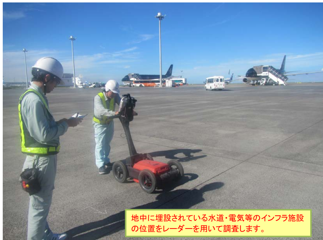
写真② 埋設物調査工実施状況