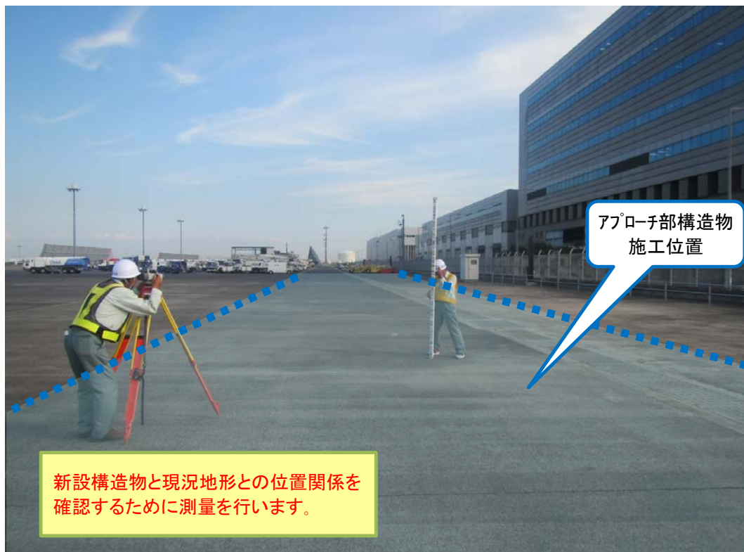
写真① 現況測量実施状況