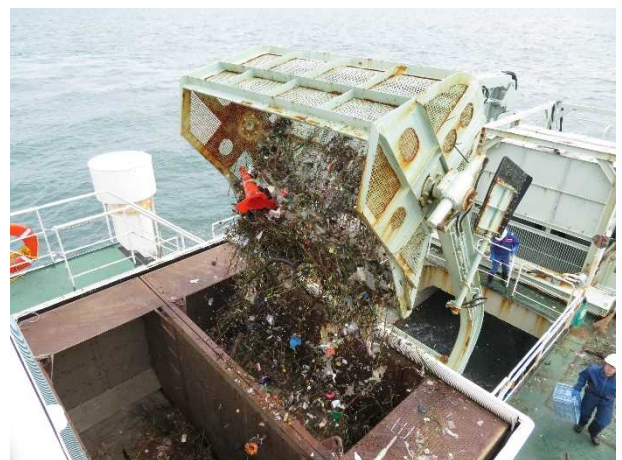
回収した浮遊物をコンテナへ格納