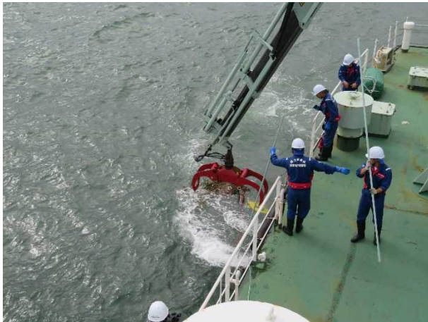
流木をクレーンで回収