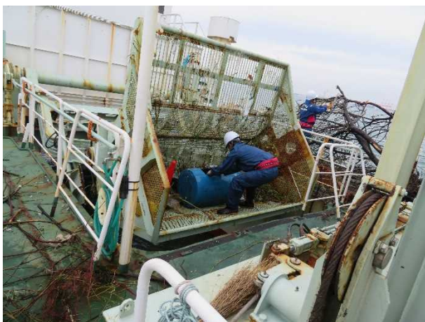
スキッパーで回収したドラム缶