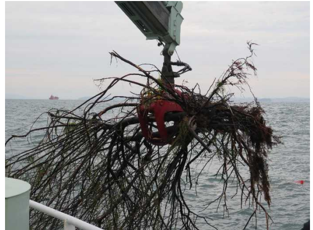
流木をクレーンで回収