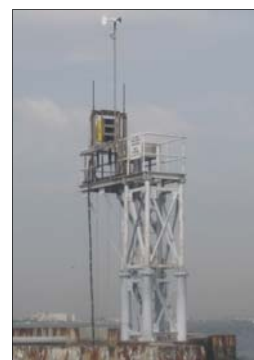
設置されたモニタリングポスト(川崎人工島)