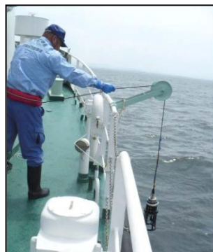
湾内6箇所にて水質調査を実施