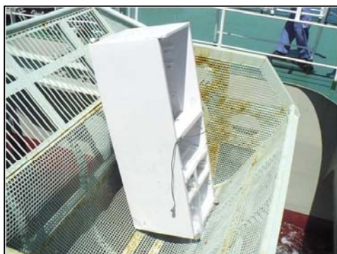
清掃兼油回収船「べいくりん」による浮遊ゴミの回収作業