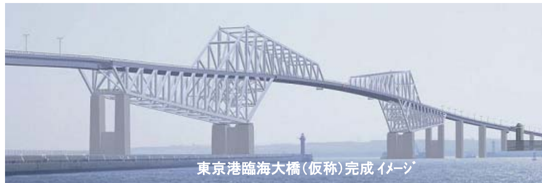
東京港臨海大橋(仮称)完成 イメージ