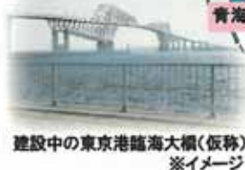
建設中の東京港臨海大橋(仮称) ※イメージ