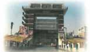
“水のエレベーター”荒川ロックゲート

住所：〒115-0042 東京都北区志茂5-41-1 TEL：03-3902-8745