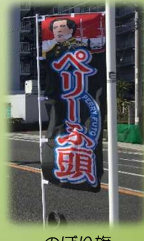
のぼり旗 (朝市開催時)