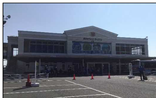
東京湾フェリー久里浜ターミナル