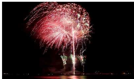
久里浜ペリー祭（花火大会）