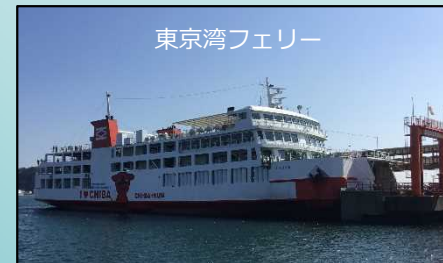
東京湾周遊特別クルーズ 久里浜港～浦賀水道航路／第二海堡接近／風の塔・羽田空港 D滑走路沖～久里浜港