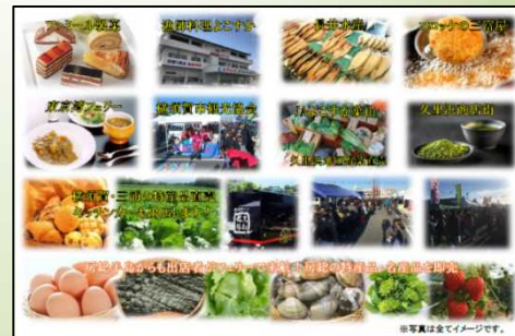
横須賀・三浦・房総からの特産品などが出展