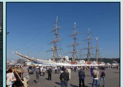
帆船日本丸寄港イベント