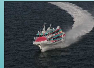
久里浜から大島を結ぶ高速ジェット船セブンアイランド