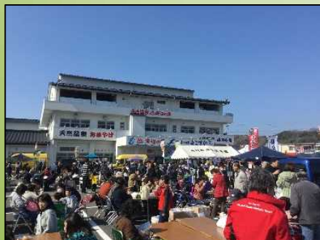
ペリーふ頭黒船朝市開催状況