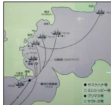
ペリーが辿った航路(ペリー記念館2階)