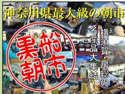
ペリーふ頭黒船朝市