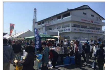
ペリーふ頭黒船朝市