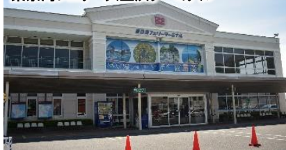
東京湾フェリー久里浜ターミナル