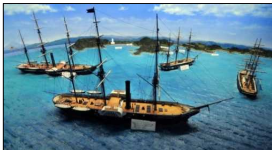
久里浜に来航した黒船の様子を示したジオラマ (ペリー記念館1階)