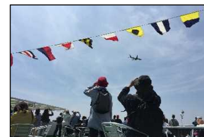
東京湾周遊特別クルーズ