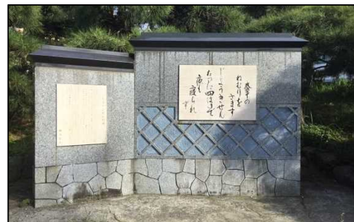
じょうきせんの碑(ペリー公園内)