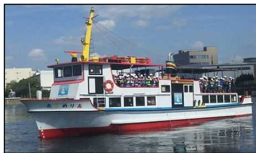
港内周遊・工場夜景クルーズ