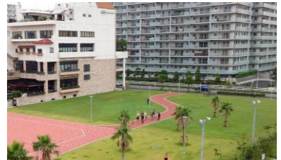
千葉みなと公園緑地