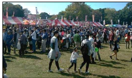
千葉湊大漁まつり