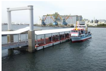
千葉みなと1号浮桟橋