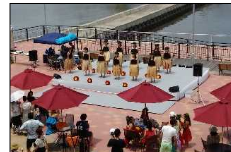
千葉みなとマリンフェスタ