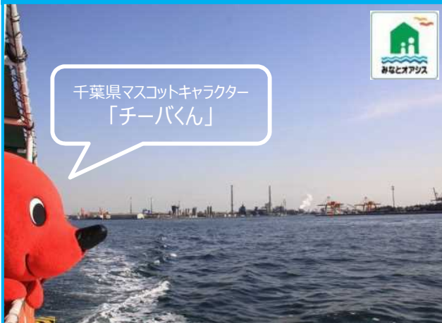
千葉県マスコットキャラクター「チーバくん」

乗って楽しく、見て学べる観光船。迫力のあるコンテナターミナルや工場の風景を楽しみながら、千葉港を間近に実感できます。