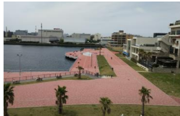
千葉みなと港湾緑地