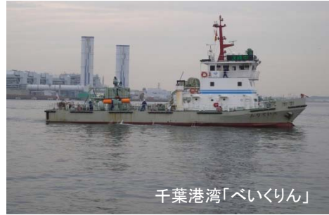
千葉港湾「べいくりん」