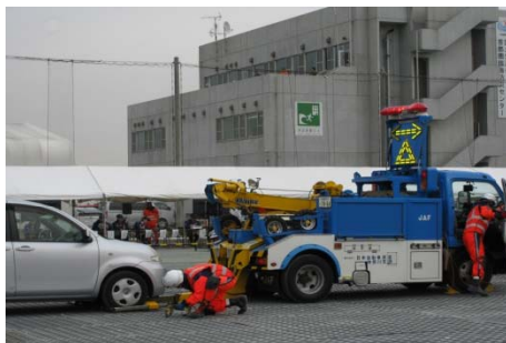
JAFによる輸送路障害車両撤去