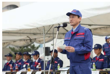
村岡海岸・防災課長挨拶