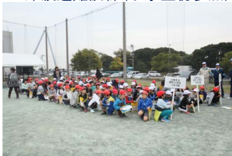
川崎市立殿町小学校4年生による、津波避難訓練