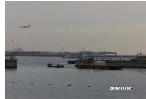
荒川 小松川リバーステーションへの物資輸送(東扇島防災拠点・舟運岸壁)