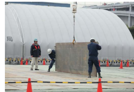
拠点内液状化応急復旧・大型敷鉄板敷設