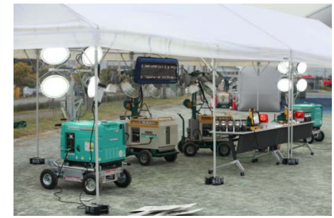
小雨の天候を想定し、テントの下に発電機付き投光機を設置