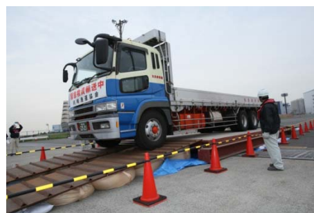
31号岸壁背後での仮設橋梁設置