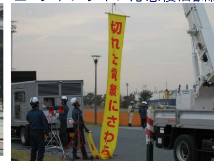
応急送電訓練 東京電力