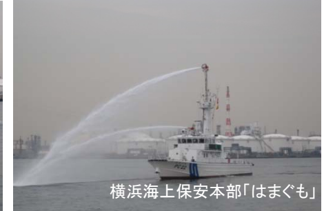
横浜海上保安本部「はまぐも」