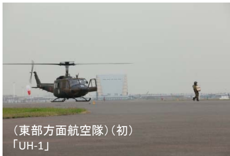
(東部方面航空隊)(初) 「UH-1」