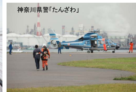
神奈川県警「たんざわ」