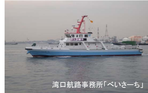
湾口航路事務所「べいさーち」