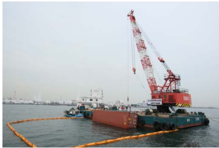
海上から40ftコンテナの引き上げ