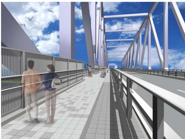
図：歩道部完成イメージ