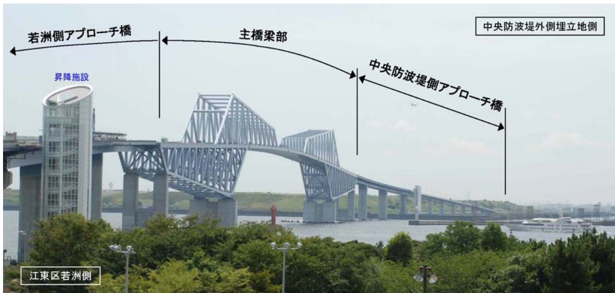
写真：東京ゲートブリッジ（若洲側より）

※橋名「東京ゲートブリッジ」は、平成22年11月に一般公募の結果により決定している。（応募件数：12,223件）