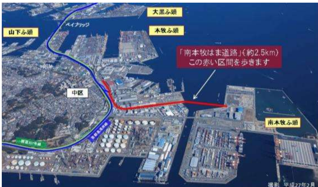
図-1 ウォーキング場所

※ウォーキングイベントの取材をご希望される報道関係者の方は、(別紙-4)取材要領をご確認のうえ、平成29年2月28日(火)18:00までに(別紙-5)取材申込書に必要事項をご記入いただき、FAXによりお申し込み下さい。