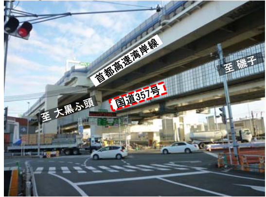
写真②: 本牧ふ頭出入口交差点