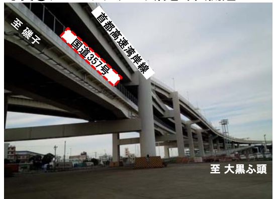
写真④: ダブルデッキの下層を今回開通