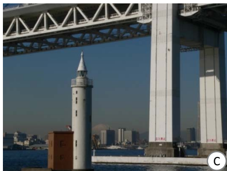
横浜ベイブリッジ(湾岸線・国道357号)からもパッチリ！