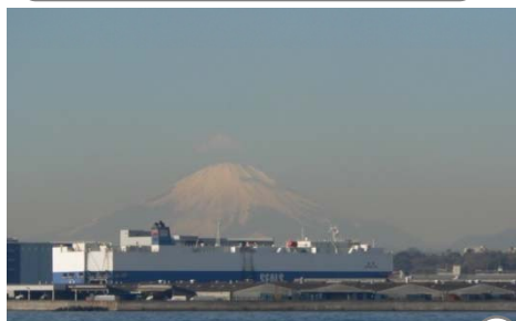
本牧海釣り施設の沖合からは、富士山が大きく見えます。