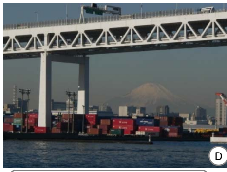
本牧ふ頭では、横浜港の6割のコンテナを取り扱っています。