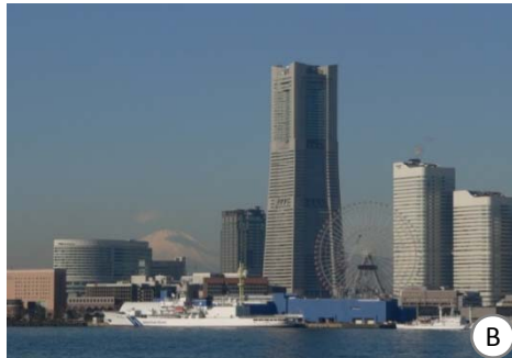
シーバス(水上バス)で横浜港をクルーズすると、ビルの間から見えます。夕暮れ時の富士山も格別です。