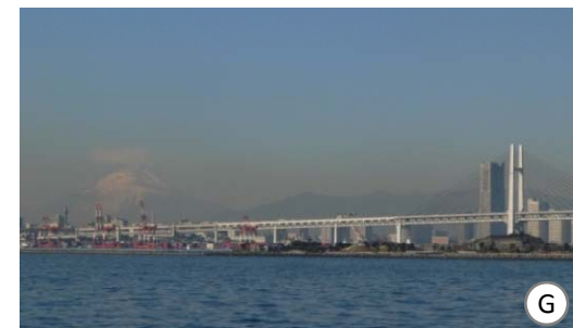
大黒海釣り施設の沖合からは、MMと横浜ベイブリッジ越しに見えます。