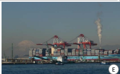
大型コンテナ船が寄港する南本牧ふ頭地区では、アジアのハブ港の地位を確保するため、新たな岸壁(設計水深20m,MC-3)を整備しています。