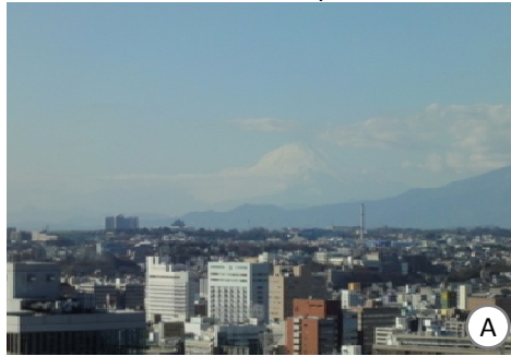
横浜港のシンボル・横浜マリンタワーの展望台からは、MMや横浜ベイブリッジ、工場夜景も見えます。

関東の富士見百景である「大黒橋国際客船ターミナル」や「鶴見川からの富士(大黒大橋、鶴見川河口から0.0km地点)」以外にも富士山のビュースポットはたくさんあります。