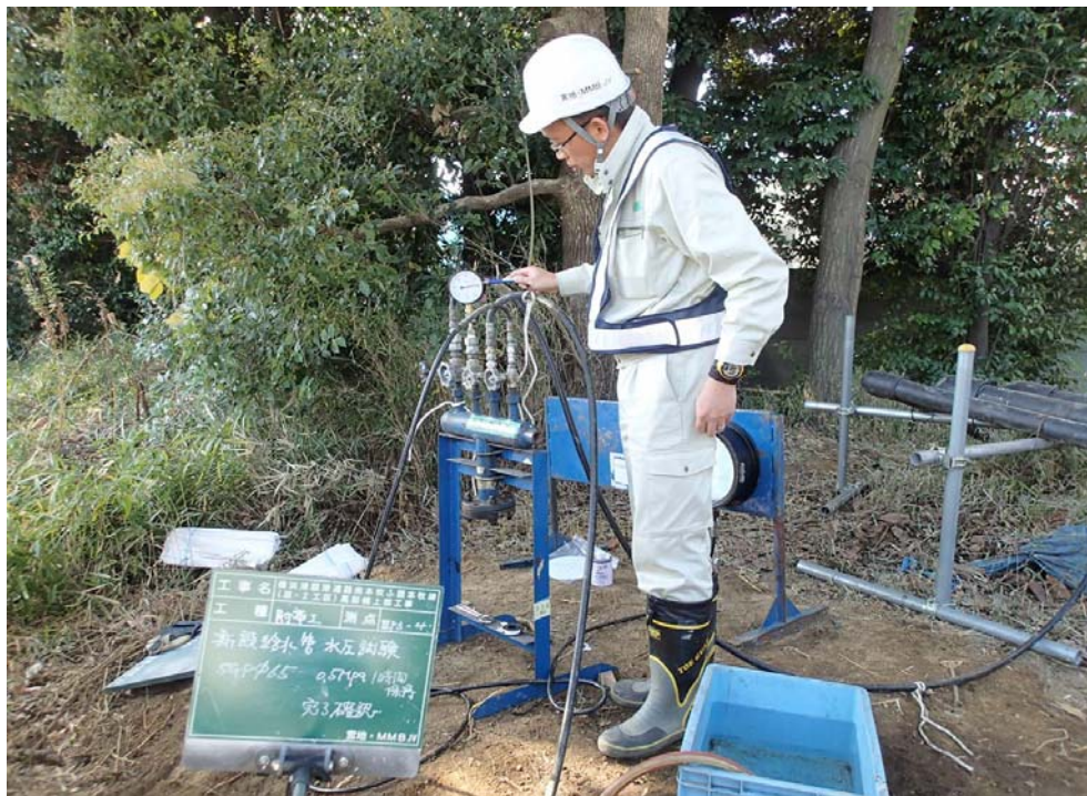
写真② 配管完了後の水圧確認状況