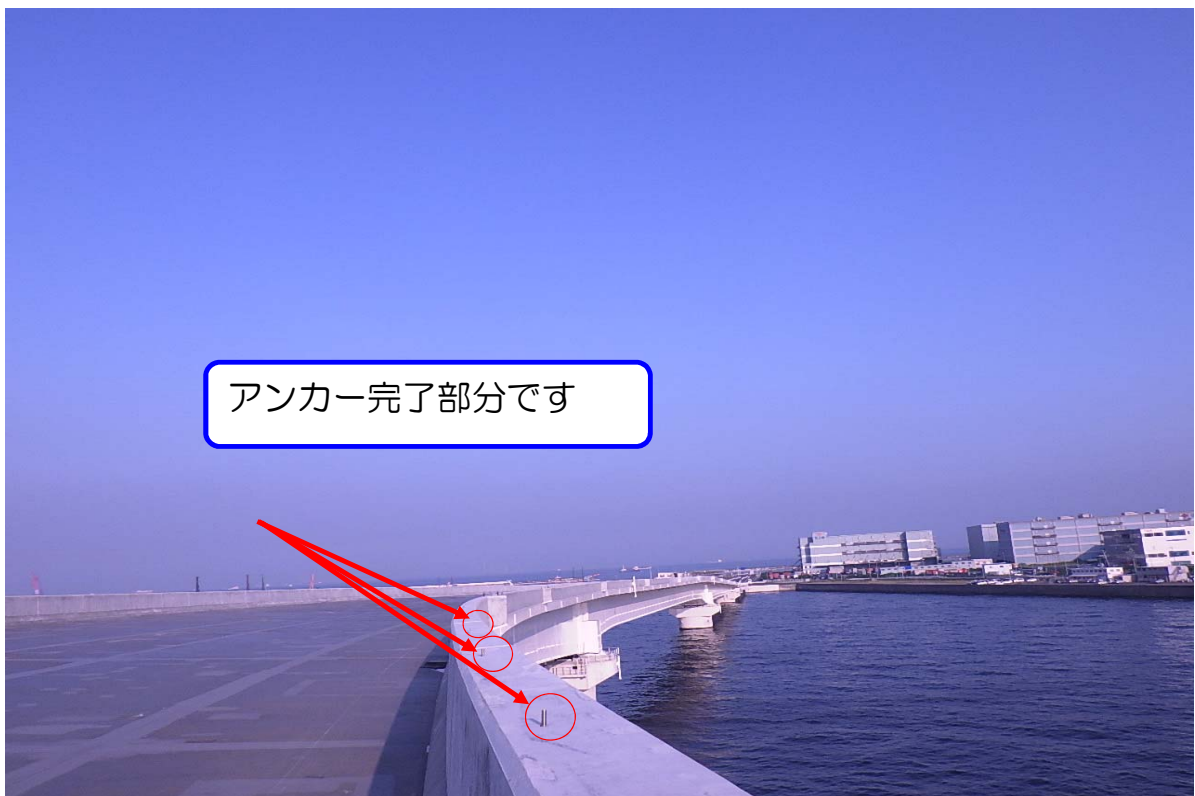
アンカー完了部分です