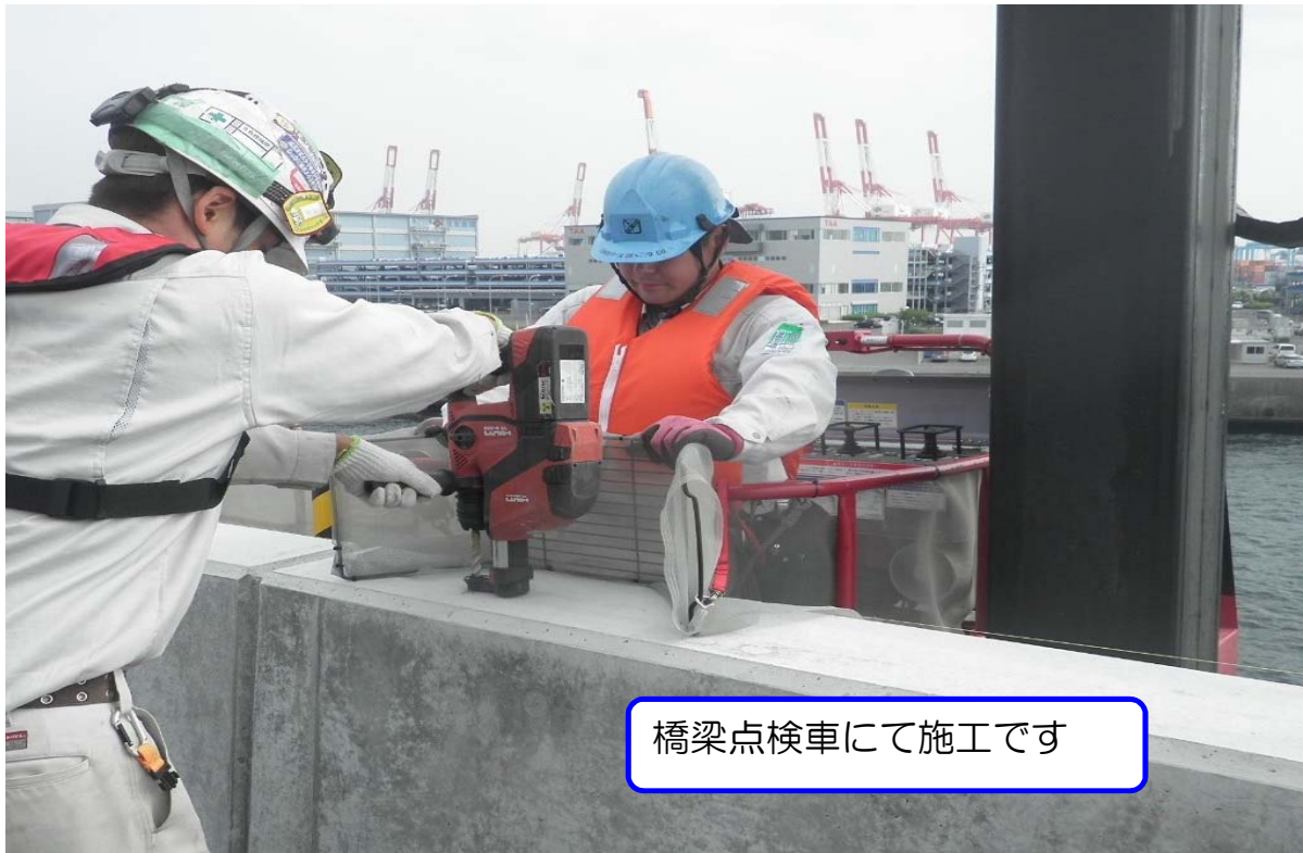
橋梁点検車にて施工です