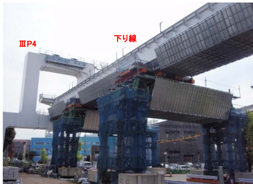
現地 平成27年9月初旬時点桁架設状況 (下り線ⅡP4～ⅢP4終点GE2まで主桁到達)