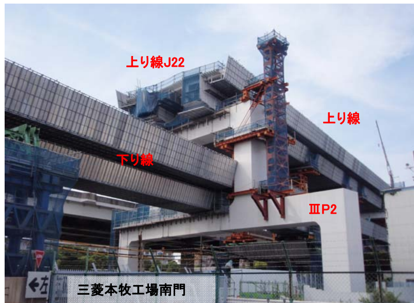
現地 平成27年9月初旬時点桁架設状況 (上り線ⅡP4～ⅢP2側J22まで架設終了)