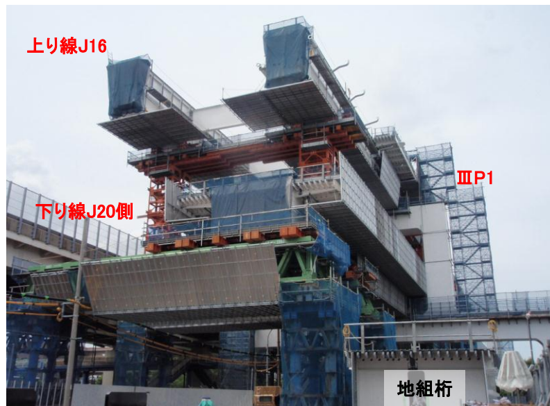
現地 平成27年6月初旬時点桁架設状況 (上り線 III P1～J16/下り線 III P1～J20)