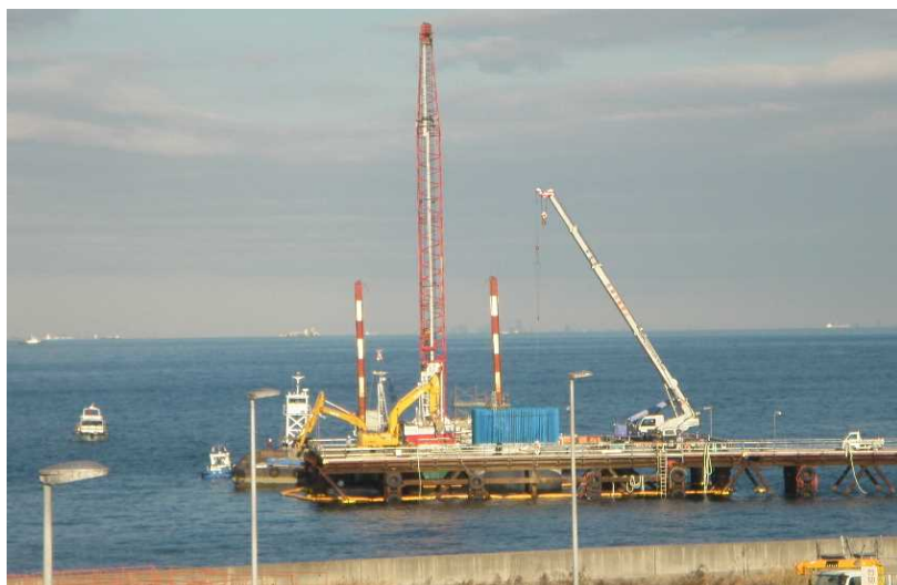
P2橋脚(13ロット) 梁部構築の施工