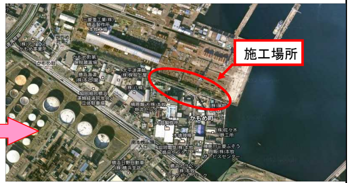
今月の工種別施工箇所平面図