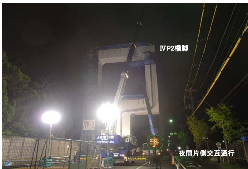
下部工排水設置状況