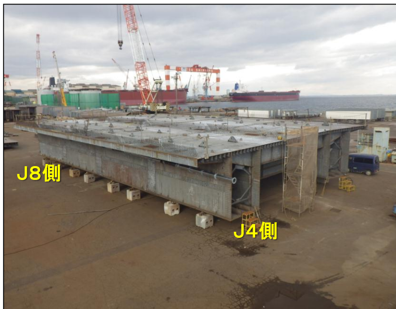
工場 桁仮組立状況(上り線J4～J8)