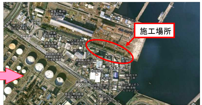
今月の工種別施工箇所平面図