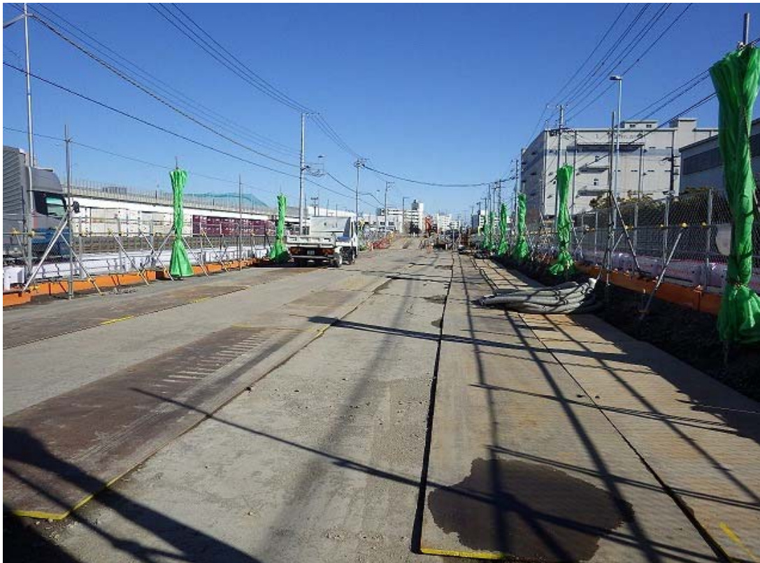
写真② 重力式擁壁工 施工状況