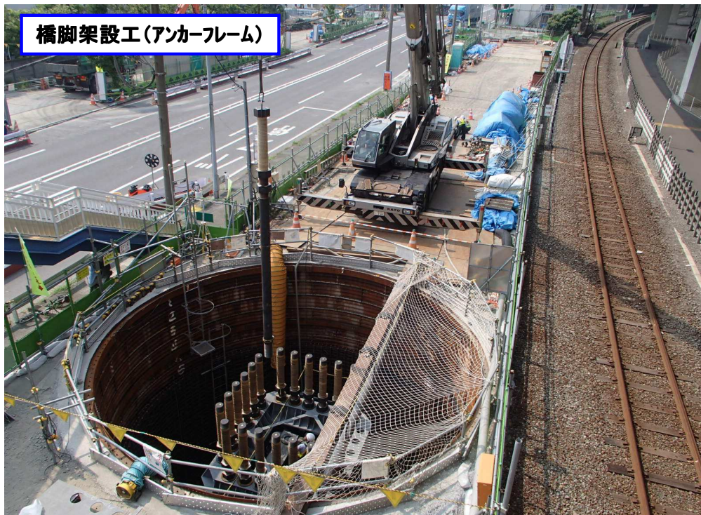
橋脚架設工(アンカーフレーム)

今月は、深礎工(掘削・土留・鉄筋組立・コンクリート打設)と橋脚架設工を行ないます。 写真は橋脚基礎と橋脚をつなぐアンカーフレームの設置状況です。