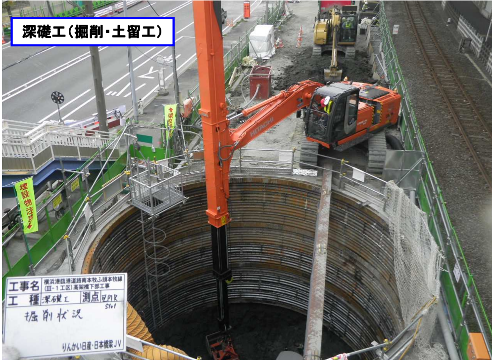
深礎工(掘削・土留工)