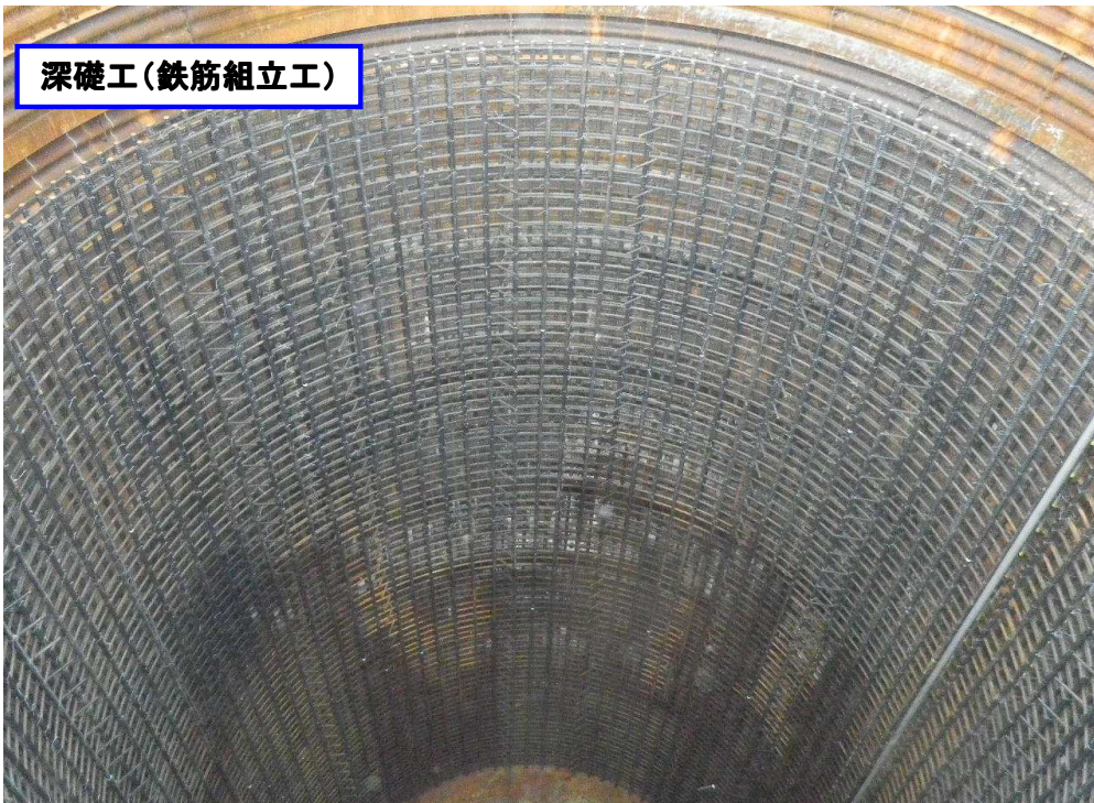
深礎工(鉄筋組立工)

所定の深さまで掘削・土留完了後、内部に鉄筋を組立ってます。組立完了後、コンクリートを打設します。