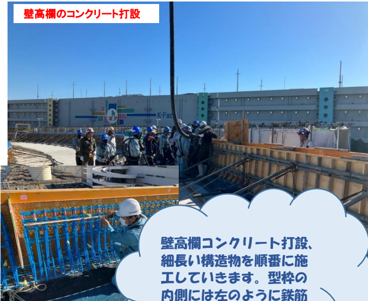
壁高欄のコンクリート打設

壁高欄コンクリート打設、細長い構造物を順番に施工していきます。型枠の内側には左のように鉄筋が組まれています。