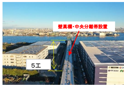
全景(5工区) 令和6年1月