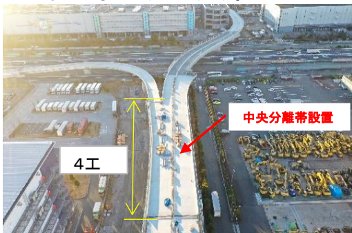
全景(4工区) 令和6年1月