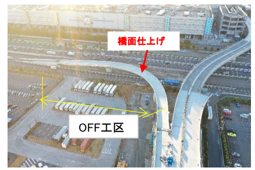
全景(OFF工区) 令和6年1月