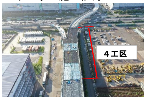
全景(4工区) 床版コンクリート打設後 令和5年10月