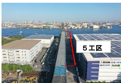
全景(5工区) 合成床版パネル設置・鉄筋組立 令和5年10月