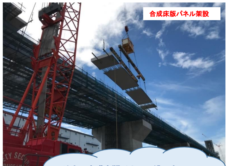
合成床版パネル架設

地上で合成床版パネルを組み立てたものをクレーンで吊り上げて所定の場所へ設置します