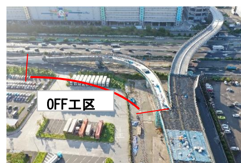
全景(OFF工区) 壁高欄鉄筋組立等橋面工 令和5年10月