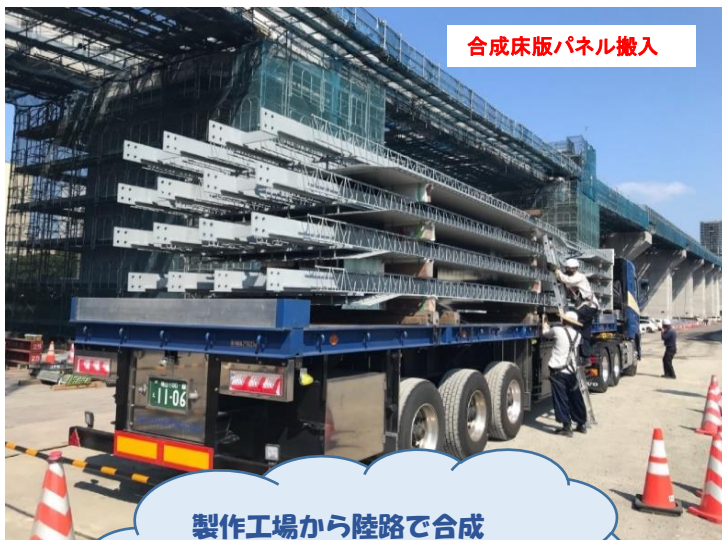
合成床版パネル搬入