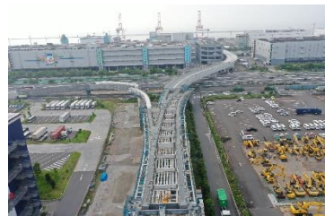
全景 (4工区～OFF工区) 令和5年5月