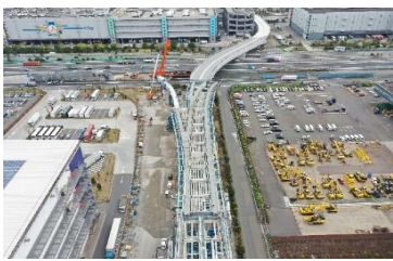
全景 (4工区～OFF工区) 令和5年3月