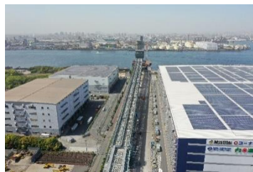
全景 (4工区～5工区) 令和5年4月