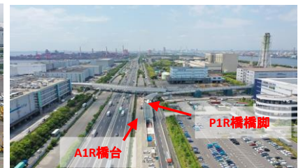
全景 (OFF工区) 令和5年6月