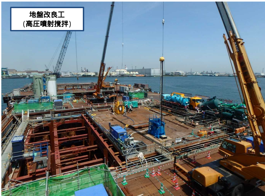
地盤改良工 (高圧噴射攪拌)