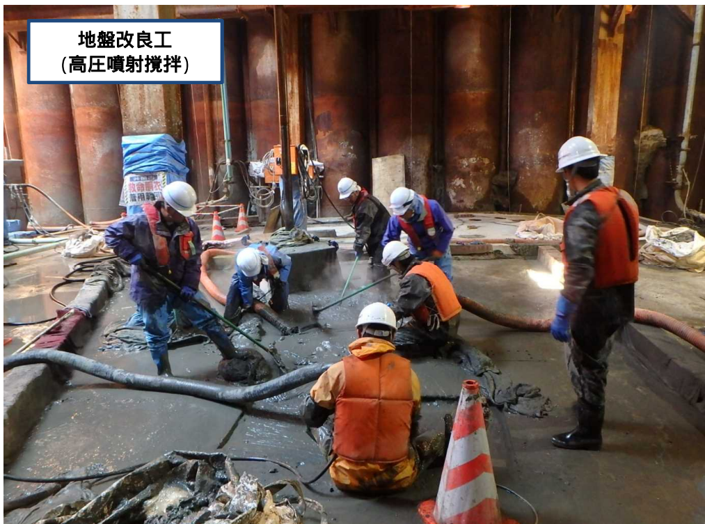
地盤改良工 (高圧噴射攪拌)