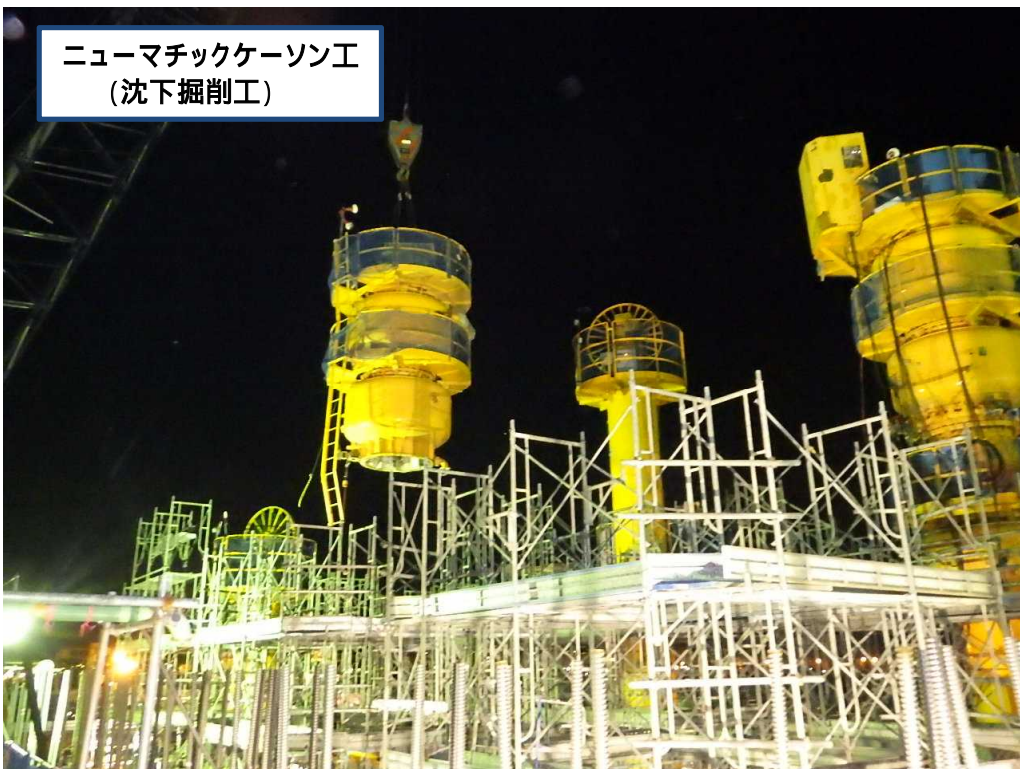
ニューマチックケーソン工 (沈下掘削工)