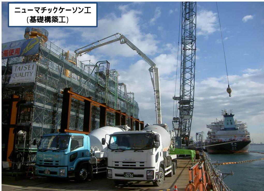
ニューマチックケーソン工 (基礎構築工)