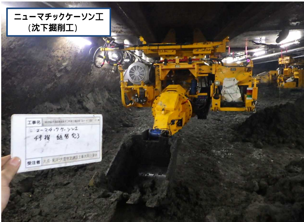
ニューマチックケーソン工 (沈下掘削工)