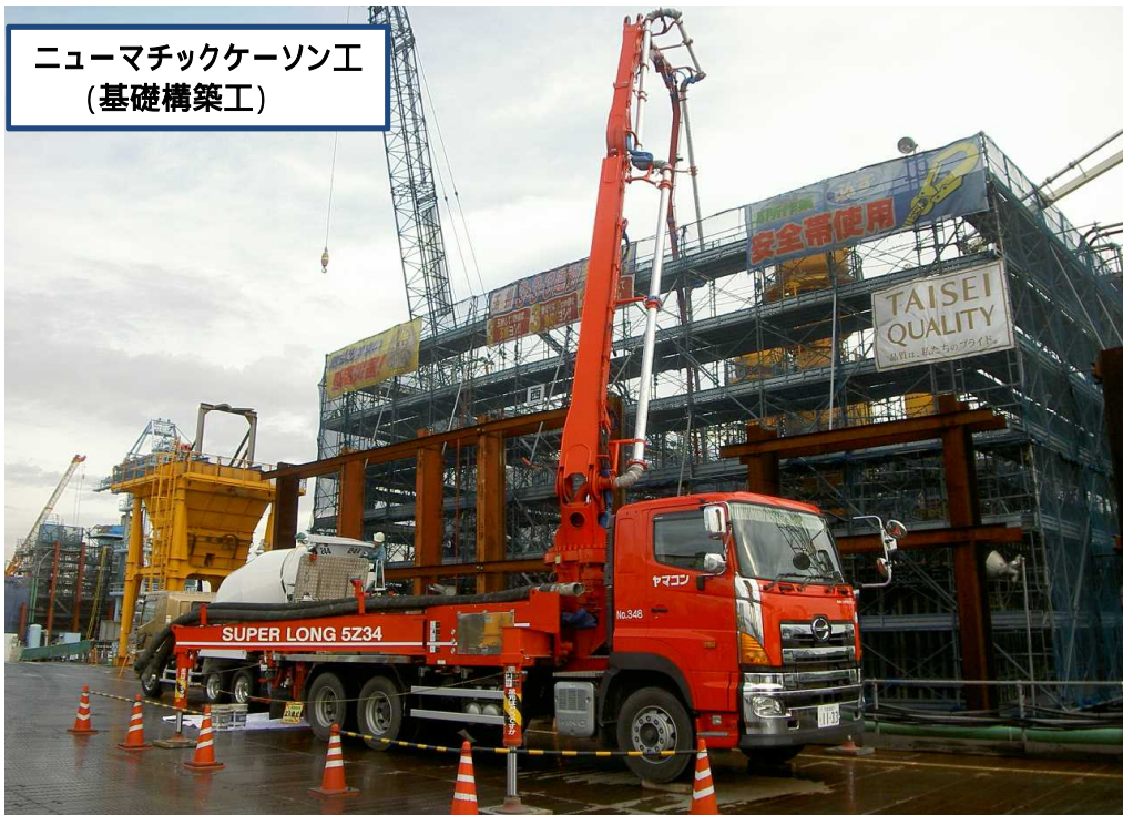
ニューマチックケーソン工 (基礎構築工)