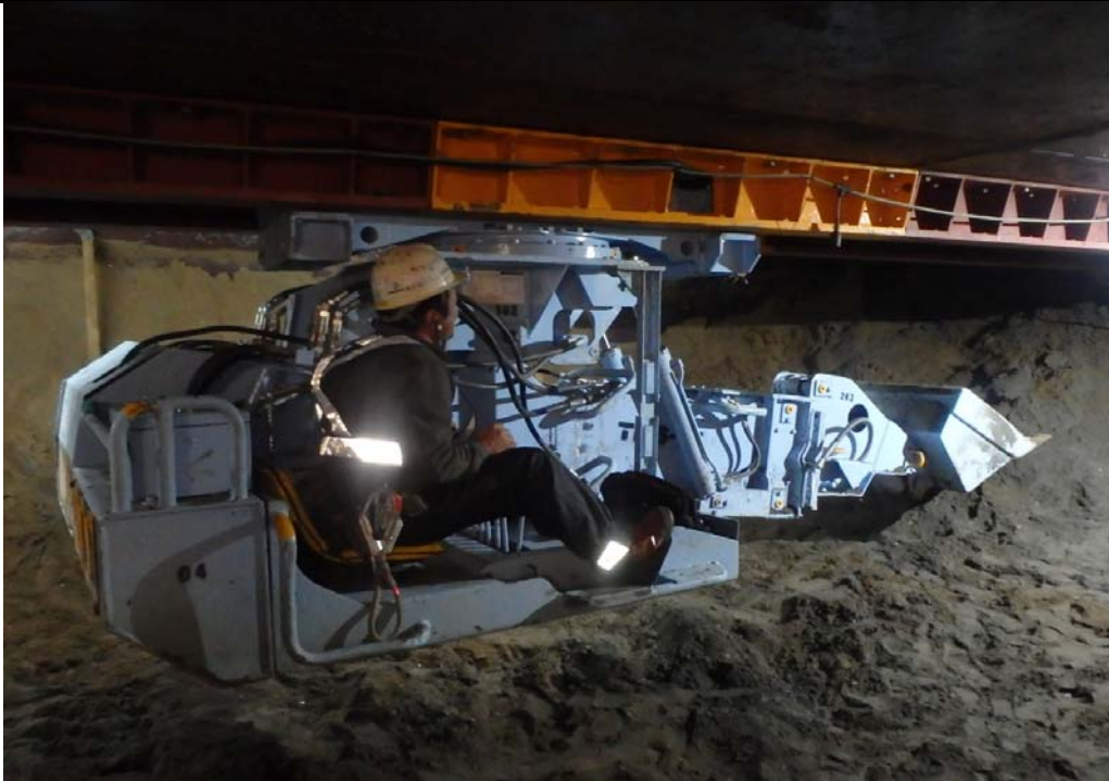
MP5(東扇島側) 地下での有人掘 削状況