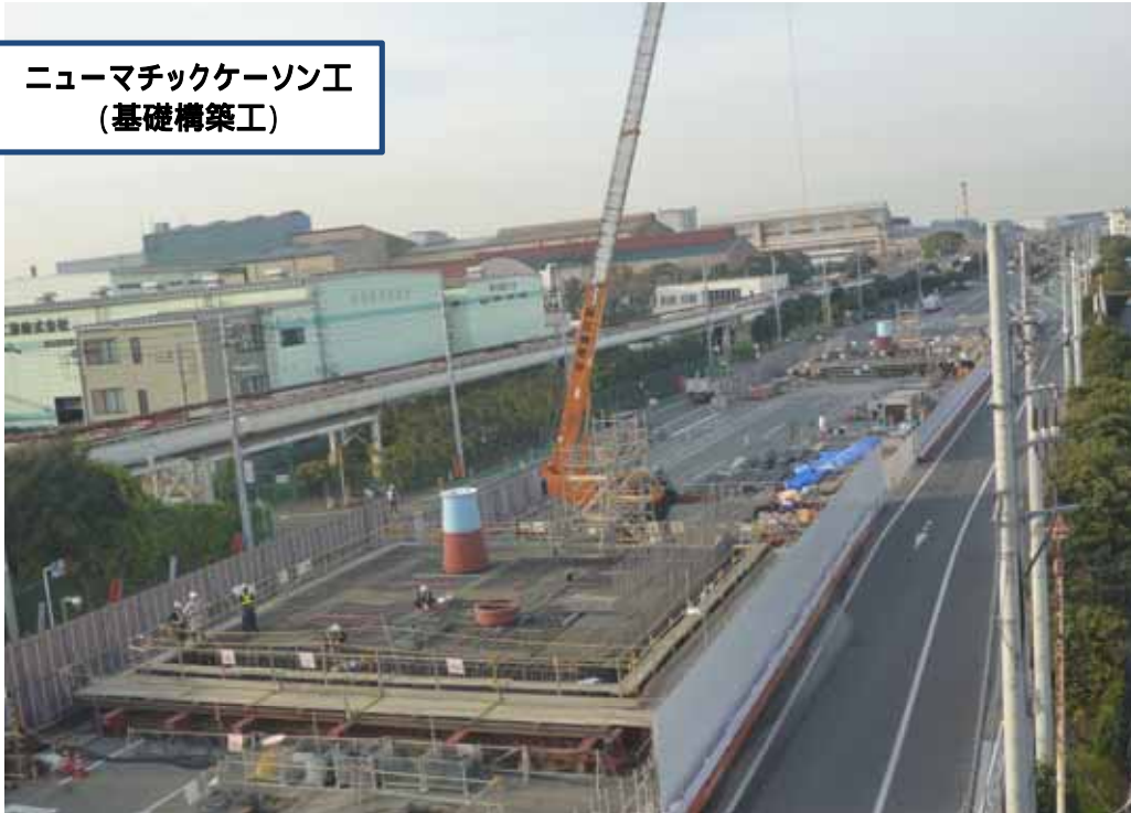
ニューマチックケーソン工 (基礎構築工)

MP5(手前側) 刃口金物据付、 第1ロットの鉄 筋組立状況で す。奥側はMP 6です。