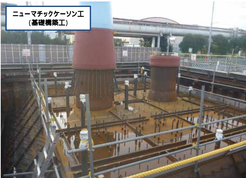
ニューマチックケーソン工 (基礎構築工)

MP6 ニューマチック ケーソン最下部 先端に刃口金 物を据付してい る状況です。