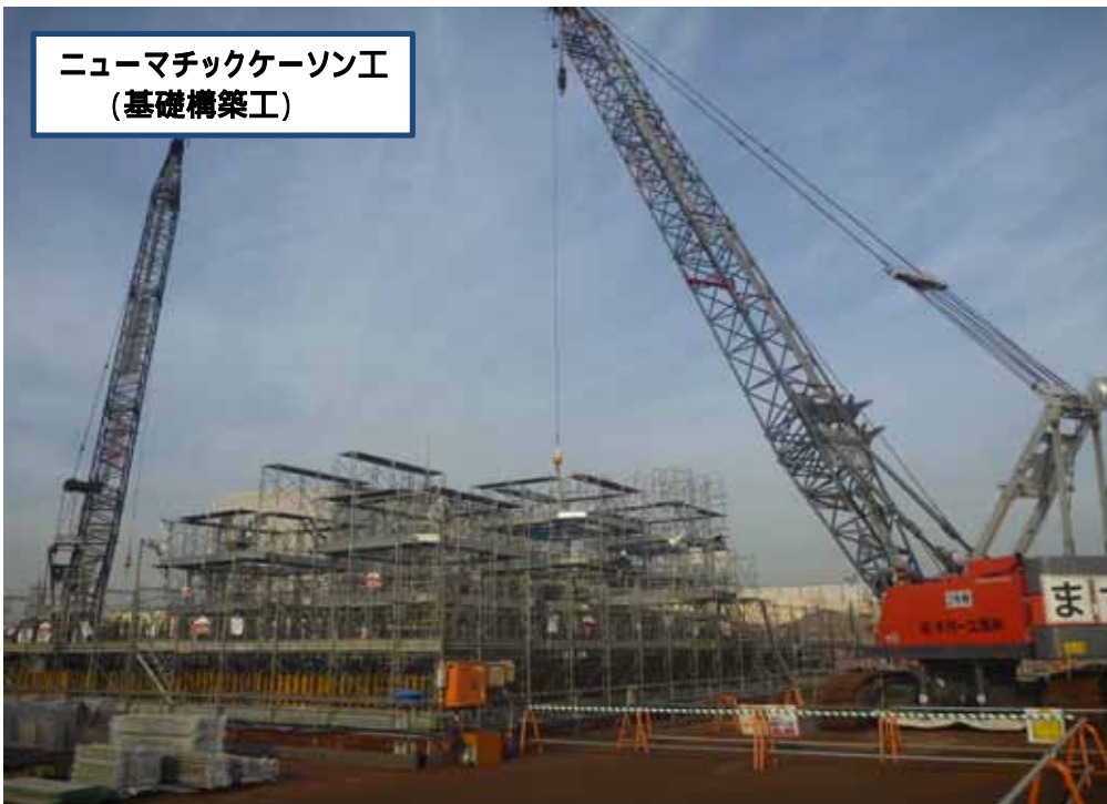
ニューマチックケーソン工 (基礎構築工)

躯体(第3ロット)の 足場組立を行って いる状況です。 この後、鉄筋・型枠 の組立を行います。