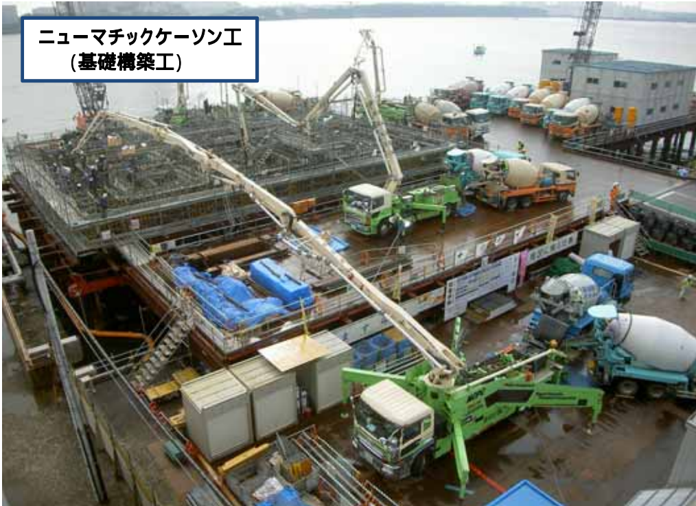
ニューマチックケーソン工 (基礎構築工)