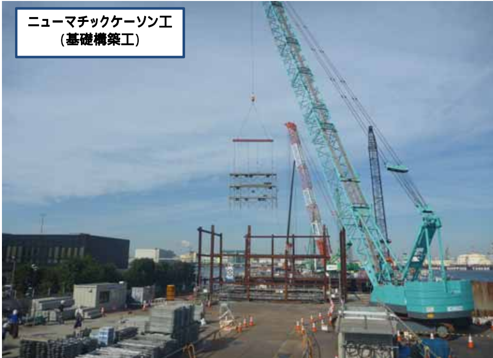
ニューマチックケーソン工 (基礎構築工)

ニューマチック ケーソン基礎の 躯体内への土砂 埋戻しに先立ち、 内部の足場材を 撤去している状 況です。