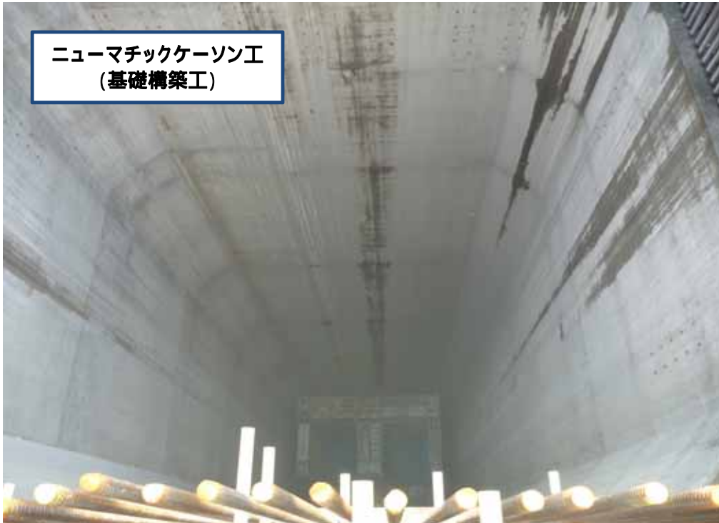
ニューマチックケーソン工 (基礎構築工)